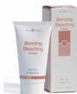
Blending Bleaching® Cream