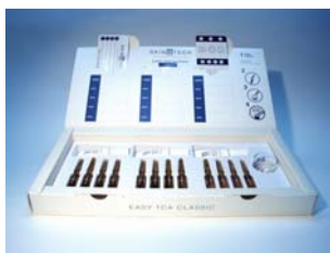
Kit Easy TCA®