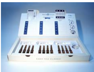
Kit Easy TCA®

Acides aminés soufrés : réduisent la production de sébum Burdock extracts : action anti acnéique directe, antiseptique, antiinflammatoire, kératolytique Triclosan : antiseptique -anti inflammatoire- antimycotique Acide salicylique : Evite l'occlusion des pores, action anti acné directe Menthol - camphre : sensation de rafraîchissement cutané